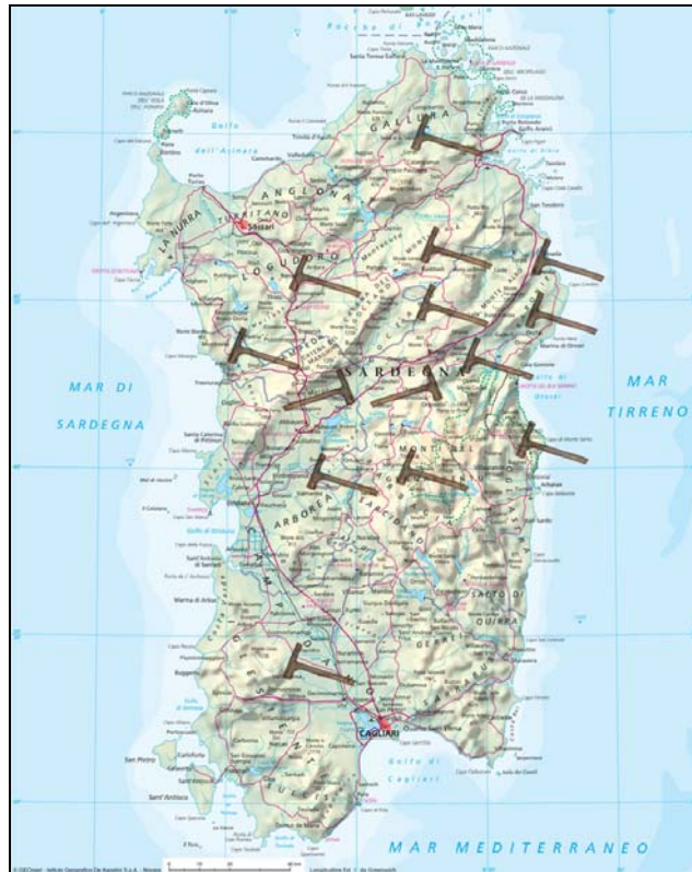
Mapa della Sardegna: i martelli indicano la zona di testimonianza dell'Accabbadura

Le ultime tracce sono a Luras, nel 1929 e a Orgosolo, nel 1952. Due episodi recentissimi e spesso portati ad esempio di una persistenza del rito fin quasi ai nostri giorni.